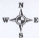
Схема расположения земельного участка или земельных участков на кадастровом плане территории в кадастровом квартале 29:22:072802 Местоположение: Архангельская область, г. Архангельск, территориальный округ Варавино-Фактория, ул. Силикатчиков, д. 19, стр.1 (категория земель - земли населенных пунктов)